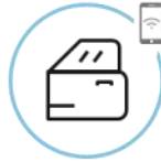
Zaključavanje/ otključavanje vozila