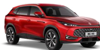
DIAMOND crvena 500,00 €