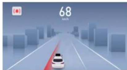
LDW Sustav upozorenja o napuštanju trake ELK Sustav održavanja vozila unutar trake u slučaju nužde LDP Sustav prevencije napuštanja trake