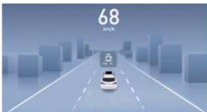
DMS Sustav praćenja umora i budnosti vozača