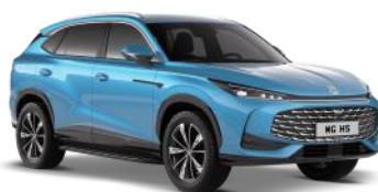
ARCTIC plava Bez naknade