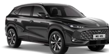
PEBBLE crna 500,00 €