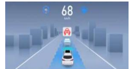
ICA Sustav inteligentne pomoći pri vožnji

Pametna prednja kamera Pozicija: prednje vjetrobransko staklo Kut pregleda: 100°