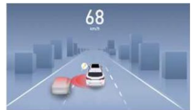
BSD Sustav nadzora mrtvih kutova LCA Sustav pomoći pri promjeni trake