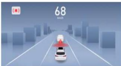
FCW Sustav upozorenja na sudar sprijeda AEB Sustav automatskog kočenja u slučaju nužde

Kada je u pitanju sigurnost, mislili smo na sve. NOVI MG HS PHEV opremljen je sustavom pomoći u vožnji MG Pilot uključuje više pomoćnih sustava, prilagodljivi tempomat, pomoć pri održavanju trake i automatsko kočenje u nuždi. Vozite s potpunim povjerenjem jer naše tehnologije brinu o vašoj sigurnosti i štite vas u svakom trenutku.