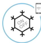
Aplikacija za daljinsko upravljanje