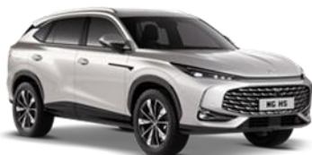
STERLING srebrna 500,00 €