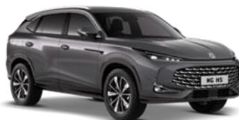
HAMPSTED siva 500,00 €