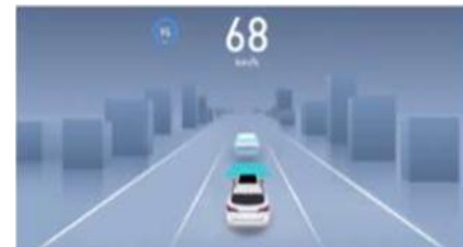
ACC Adaptivni tempomat